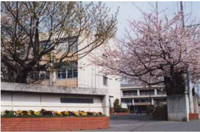
校門で満開となっている桜

暦は5月となり、今年も恒例の三鷹高校同窓会総会の季節が参りました。本年も別掲のとおり学校を離れた会場にて開催いたします。皆様ご存じのとおり、都立高校をとりまく状況は急激に変化しており、我が三鷹高校もその例外ではありません。同窓会総会は多くの現・旧職員の方々も出席を予定されており、なつかしい話や最近の話題でひとときを過ごすのはいかがで