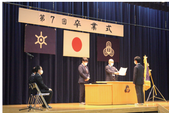
▲3月5日に中等7期生(通算71期)の卒業式が挙行されました

さて、そうした社会状況の中にあつて、私共同窓会としても、活動を制限されながらの一年でした。何かの行事を計画しても、コロナの感染状況を確認しながら、結局は人が密に集まることを避けるという行政の方針に従い、中止せざるを得ないという日々でした。それでも、役員が少人数で集まって情報交換をし、学校との連携のもと、現役生の活躍を応援するという同窓会の活動方針の一つを、しっかりと展開して参りました。わが母校は、文・武両道を旨とした方針で生き生きとした活動を行っておりますが、令和3年度も、進学で目覚ましい結果を残したり、部活においてもスポーツの分野や文化活動の分野でも、大きな成果を挙げました。大変すばらしいことであり、同窓会としても可能な限りの応援